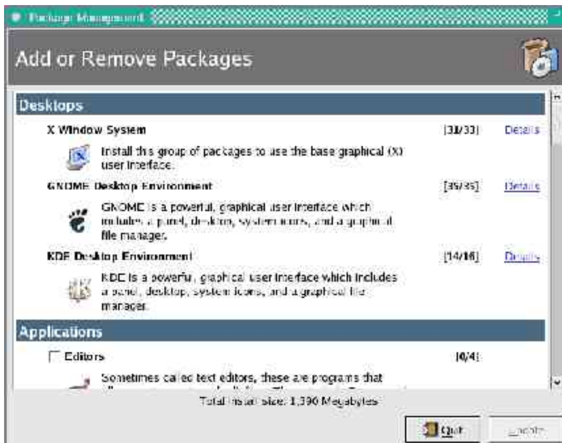
(Gambar 1. Manajemen Paket di Red Hat Linux)

Anda kemudian akan mendapatkan sebuah jendela bernama Package Management (tertulis di pojok kiri atas dari jendela tersebut).