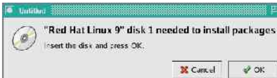
(Gambar 3. Red Hat meminta CD pertama untuk melanjutkan instalasi)

4. Red Hat akan meminta Anda untuk memasukkan salah satu CD yang anda punya. Masukkan CD yang diminta kemudian klik OK